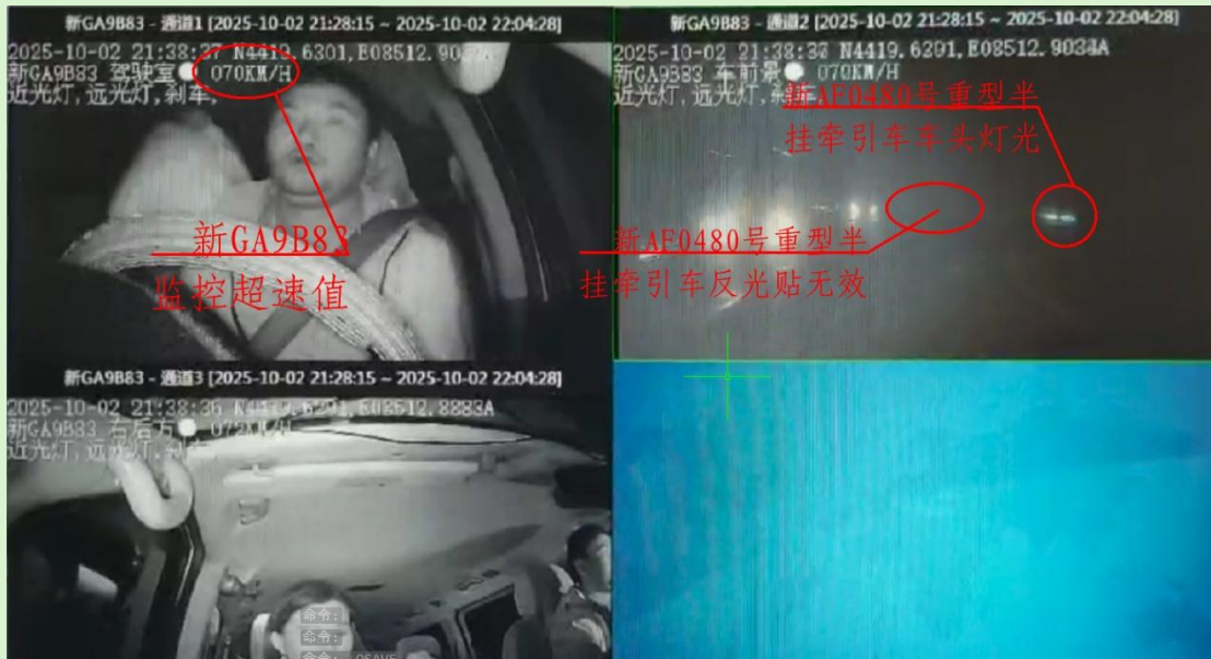
图 2 事发前新 GA9B83 视频监控图